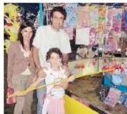
Tanti gli intrattenimenti e i giochi dedicati ai più piccoli: giostre, pesche e premi e danze per bambini

LAINATE (job) La fiera di san Rocco si rivolge a tutti, ma con particolare attenzione alle famiglie, perché molti sono gli intrattenimenti dedicati ai più piccoli, a cominciare dai giochi (giostre, trenino, pesca a premi, etc); e ancora molte iniziative, per ogni fascia di età, sono previste per questo fine settimana. Venerdì 9, alle 20.45, si terrà lo spettacolo dal vivo di musica moderna «Musichiamo» (2ª edizione), a cura di Dimensione Cultura con la collaborazione dell'accademia Dimensione Musica di Lainate e la partecipazione della scuola Movin'up Progetto Danza. Sabato 10, alle 16, è in programma un «Pomeriggio con Ilan Vitale», danza per bambine, danza del ventre e lezioni di Zumba; alle 18.30, si