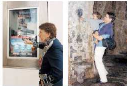
Lo schermo multimediale di 46 pollici è l'innovativo strumento del Progetto Mercurio