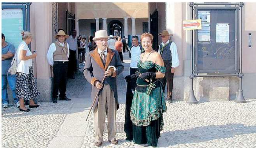
SPETTACOLO Una rievocazione storica organizzata dagli «Amici di Villa Litta» per attirare il pubblico (Sn)

Il display verrà presentato domani alla Fiera di S. Rocco